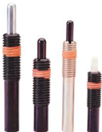
弹簧定位柱规格表